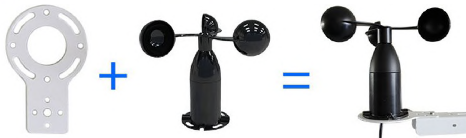
Lacquered mounting plate Wind Speed Sensor Installation and fixation